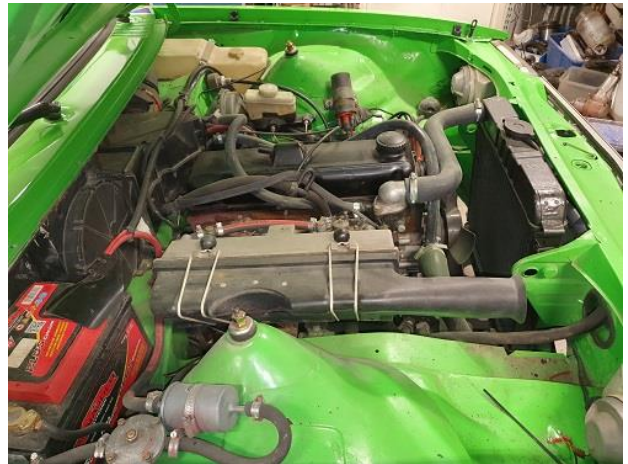
h) Moottoritila oikealta