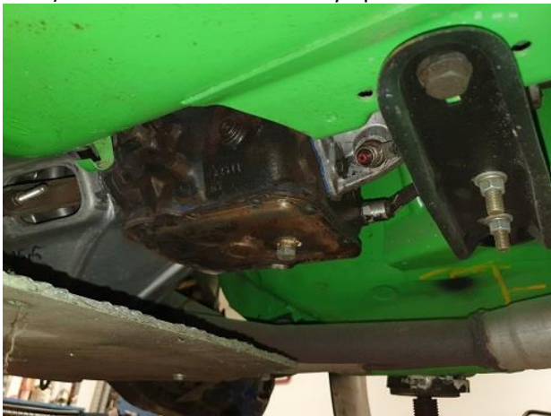
i) Vaihdelaatikko ala- tai yläpuolelta