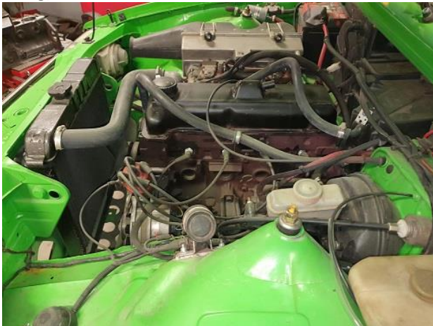
g) Moottoritila vasemmalta